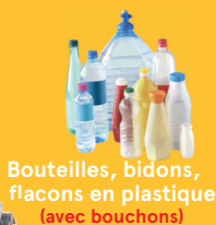
Bouteilles, bidons, flacons en plastique (avec bouchons)

Briques (avec bouchons) Papiers, journaux, revues